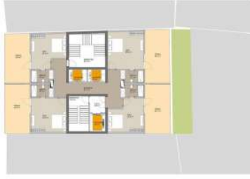
03 Planlar / Çatı Kat Planı