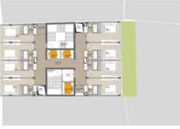
03 Planlar / 1.-4. Kat Planı