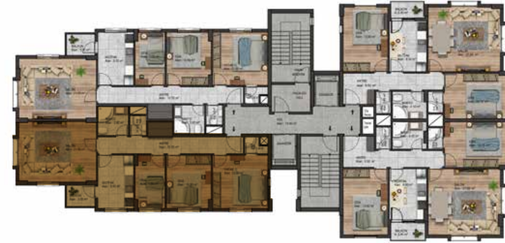
Normal Kat Planı