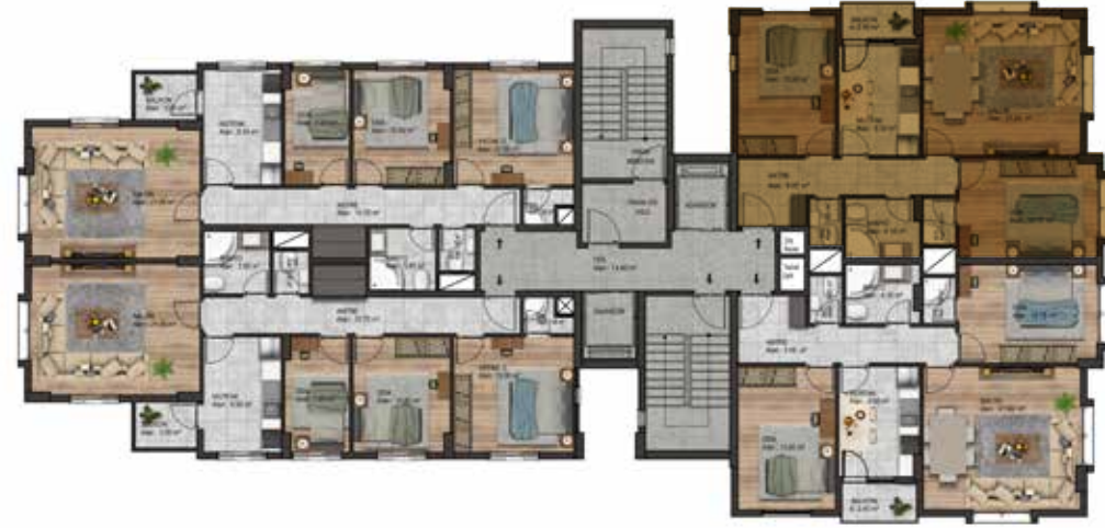
Normal Kat Planı