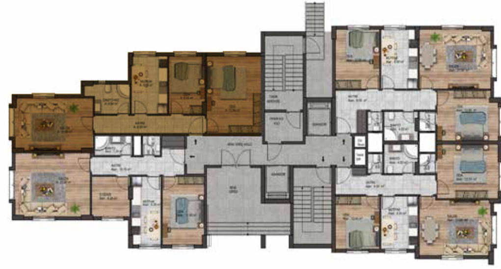
Zemin Kat Planı