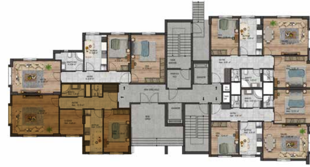
Zemin Kat Planı